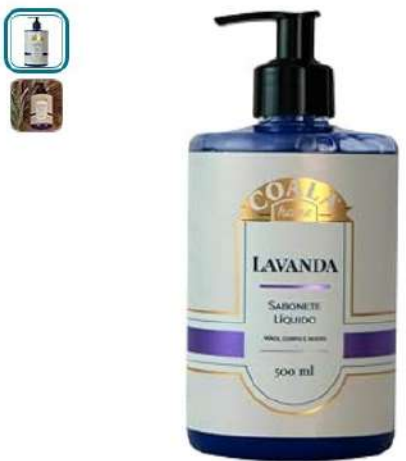
Passa o mouse para ampliar a imagem

Coala Sabonete Líquido 500ml Lavanda Visite a loja Coala 4,2 74 avaliações de clientes Pesquisar nesta página Mais de 600 compras no mês passado